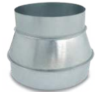
VCRHGB/ Reducción helicoidal con flexicel