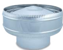
VCSAIX/ Sombrero antirrevocante inox