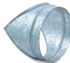
VCIJG45/ Injerto galva 45°