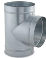
VCTEHG90B/ Te 90° helicoidal con flexicel