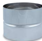
VCMPHIX/ Manguito pieza helicoidal inox