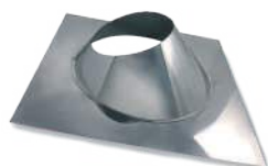
VCCAIX/ Cubreaguas inox