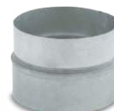
VCMHIXMH/ Manguito M/H helicoidal inox