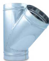
VCTEHIX45/ Te 45° helicoidal inox