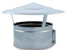
VCSFIX/ Sombrero fijo inox