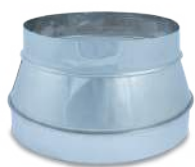
VCRHIX/ Reducción helicoidal inox