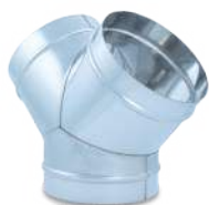
VCYHIX/ Y helicoidal inox