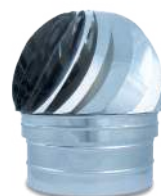
VCSASIX/ Sombrero aspirador inox