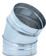
VCCHIX45/ Codo 45° helicoidal inox