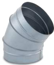
VCCHG45B/ Codo 45° helicoidal con flexicel