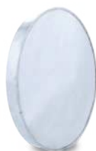
VCTPHIX/ Tapón inox