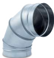
VCCHIX90/ Codo 90° helicoidal inox