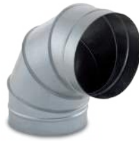
VCVCHG90/ Codo 90° helicoidal con flexicel