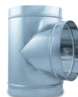
VCTEHIX90/ Te 90° helicoidal inox